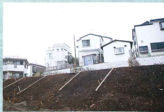
憧れの湘南ライフ&ガレージライフが一度に実現します。下の写真は造成工事が完了したばかりの現場。次号はもう少し進んだシチュエーションをお見せできると思います！