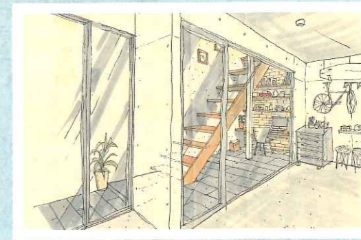
リビングから階段で下に降りると目の前に広がる、ガラス越しのガレージ。単なる車庫ではなく、オーナーの想像力を刺激できる見た目にも美しい設計