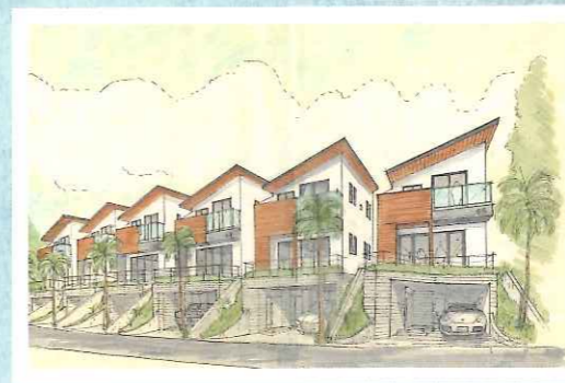
区画内には全9棟のガレージハウスが。「個」から「輪」へ。さまざまな趣味を持つオーナーが集い、魅力的なクリエイティブ・コミュニティが生まれますように

湘南レーベル・エンターテインメント ☎0466-50-8040 www.shonan-label.com